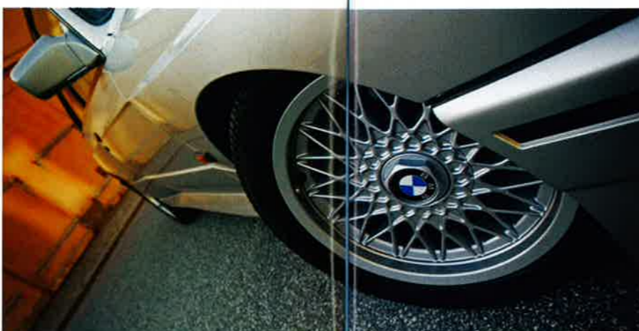
DET MESTA UNIKT. M3 har inte mycket gemensamt med vanliga 3-serien. Det är i princip bara motorhuven som är identisk – och baklyktorna förstas! Övriga 3-serieprogrammet fick nya 1988.