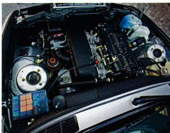
ÖKNING. Modellåret 1990 var ett bra år för BMW M3. Effekten ökade från 195 till 215 hk.