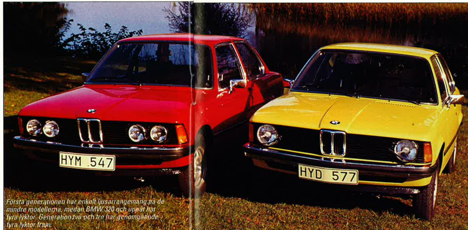
Första generationen har enkelt ljusarrangemang på de mindre modellerna, medan BMW 320 och uppåt har fyra lyktor. Generation två och tre har genomgående fyra lyktor fram.

BMW 316 utrustas samtidigt med styrningsdämpare i likhet med övriga modeller. På grund av bakre nummerskyltens