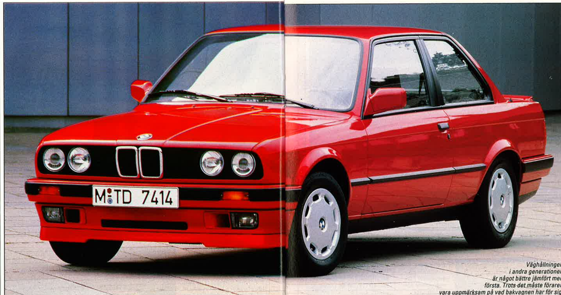
Väghållningen i andra generationen är något bättre jämfört med första. Trots det måste föraren vara uppmärksam på vad bakvagnen har för sig.