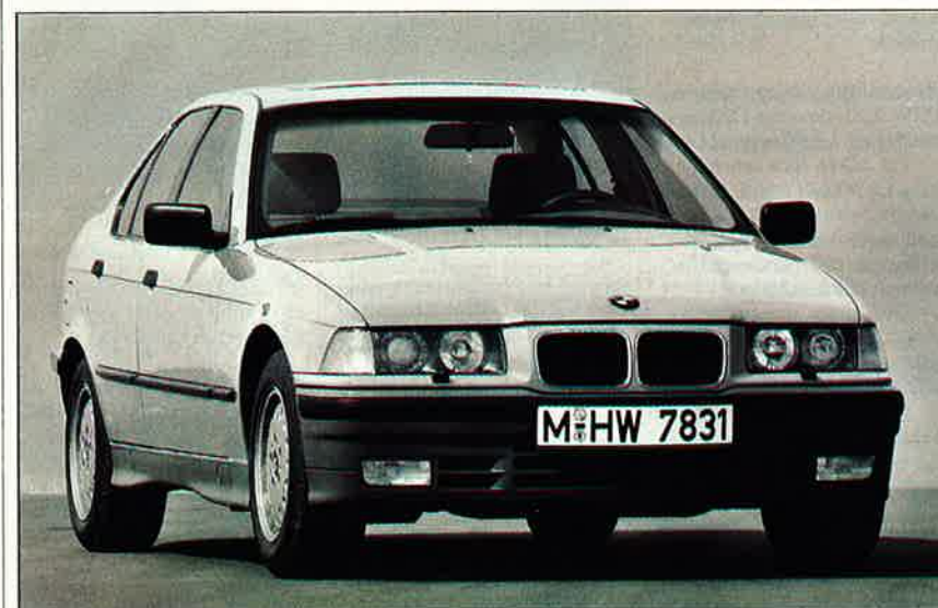
Senaste generationen (E 36) av 3-serien är en helt nya bil. Nu är väghållningen så bra att sanna BMW-vänner muttrar och tycker livet var bättre förr.

320i (323i försvinner!), 325i (Nyhet! Kan fås med fyrhjulsdrift samt som cab).