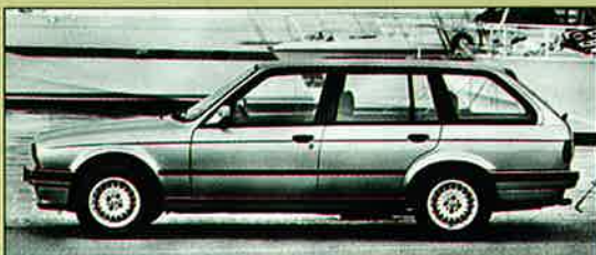
Touring-modellen är praktisk men knappast lika rolig som Coupén.