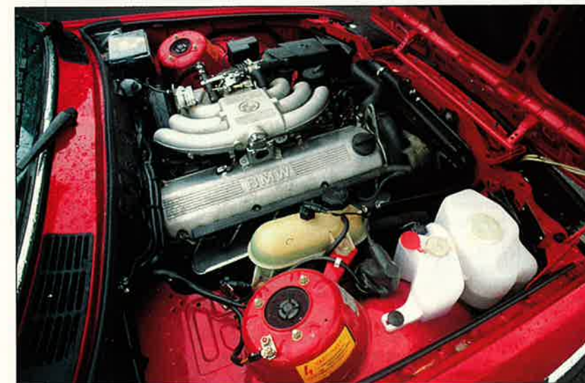
De sexcylindriga motorerna i E 30 är allmänt roligare än de fyrcylindriga. Se upp med de första årsmodellerna av E 30 på åttiotalet. BMW 320 har bara 1,8-liters motor!

På de fyrhjuldrivna bilar har du en viskoskoppling